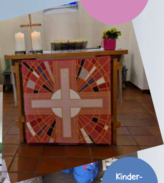
neue rosa Paramente in Seußen